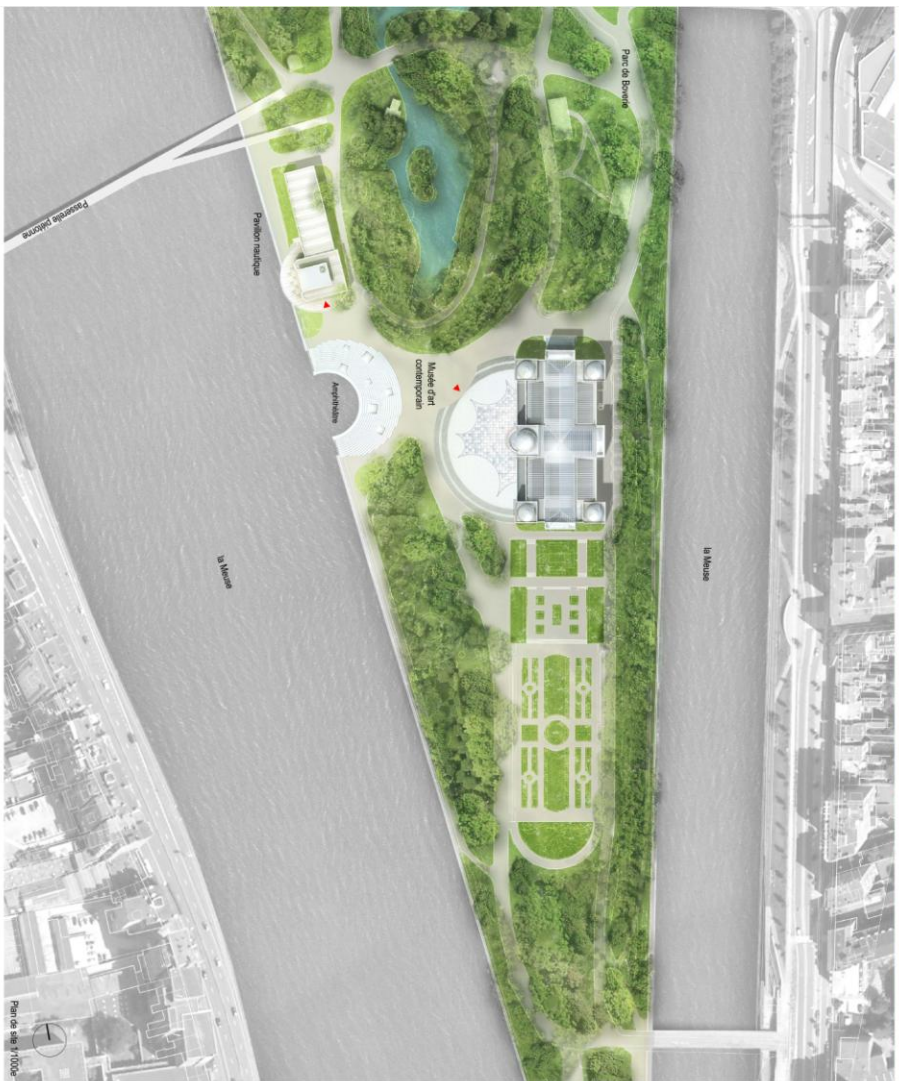
CENTRE INTERNATIONAL D'ART ET DE CULTURE, Parc de la Boverie à Liège