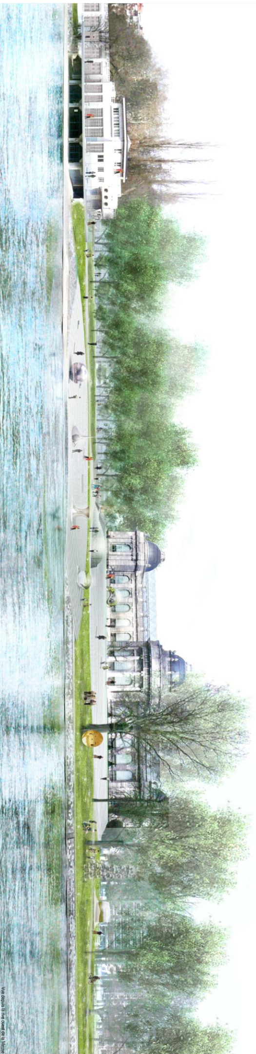
Vue depuis la rue Omer de la Motte