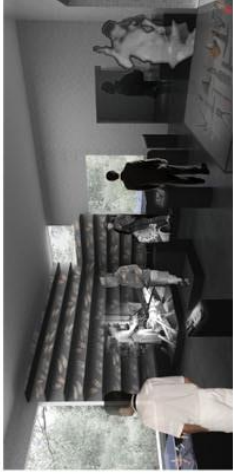
13 - L'artisanat