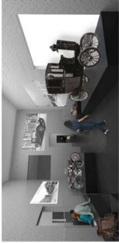
11 - Les voitures: une commune en châtier