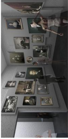
12 - L'artisanat bourgeois: galerie de peintures