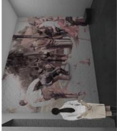
14 - Une tradition