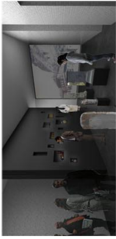
10 - Introduction: la transmission