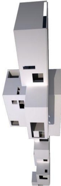
vue accumulation de plateaux forée une volumétrie porreuse sur le parc