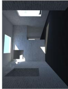
vue sur le parc depuis le plancher de niveau et son environnement actuel.