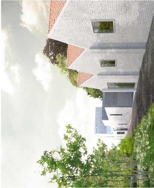
vue depuis la voirie (tourant le cour de l'Académie)