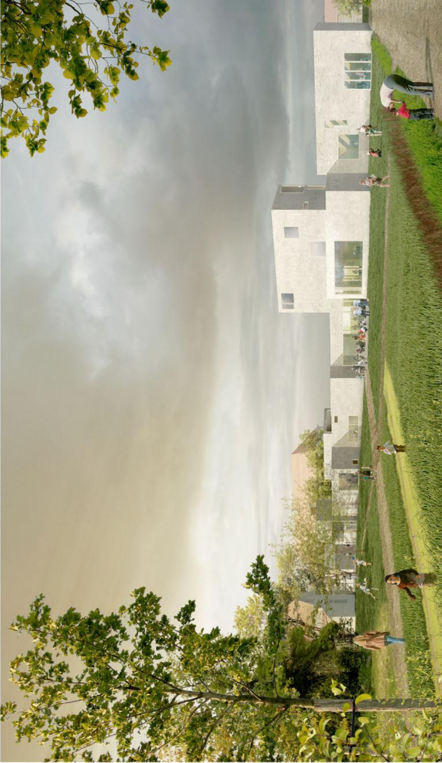
vue depuis le parc