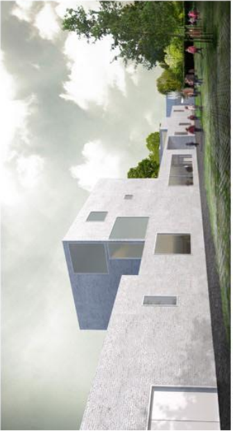
vue depuis le parking Boveris.