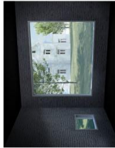
vue sur le parc depuis les plates d'implantation