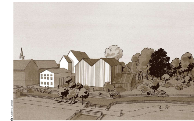
0 10 50 1/1000ème