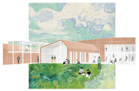
5. LE VILLAGE - LA PLACE Dialogues pluriels entre corps, culture et société.

LA RÉINSERTION PAR LE TRAVAIL COMME SOCLE DU PROJET THÉRAPEUTIQUE ET ARCHITECTURAL