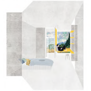
1. UNE CHAMBRE À SOI - LA FENÊTRE lieu de l'intime. Habiter l'épaisseur de la façade, s'approprier la limite afin de mieux la dépasser.