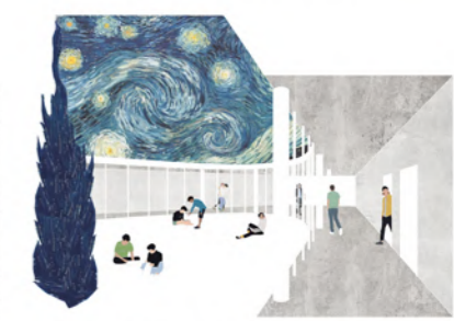
2. JARDIN INTÉRIEUR - LA PORTE Le couloir comme premier seuil de socialisation, d'échange avec l'autre, déambulations et pérégrinations communes.