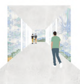
4. LA GALERIE - HORIZON Passerelle entre la maisonnée et le village. Impulsion individuelle vers espaces partagés, démarche proactive.