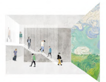
3. L'ATRIUM - DOUBLE HAUTEUR Espace de convergence entre intérieur et extérieur. Volume d'épanouissement du patient et du soignant.